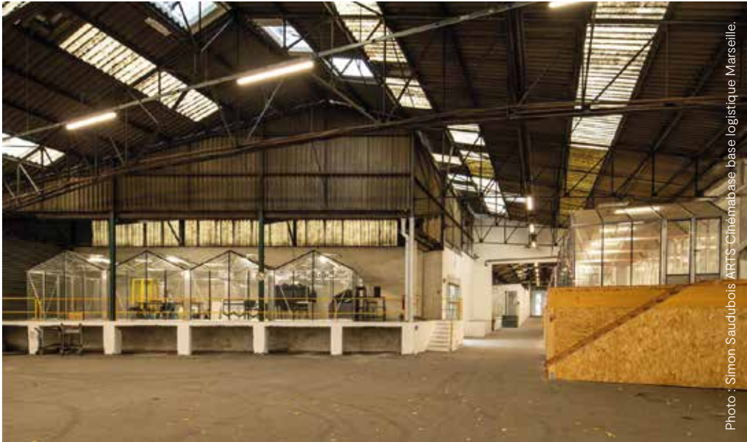
ARTS Cinéma base base logistique Marseille.