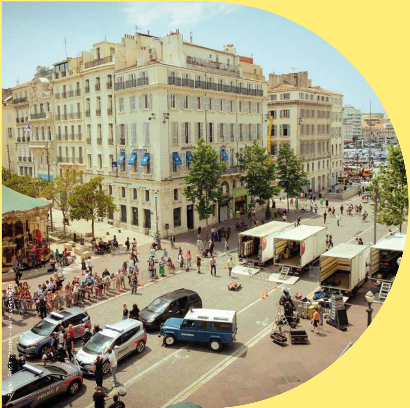
Heureux Gagnants.