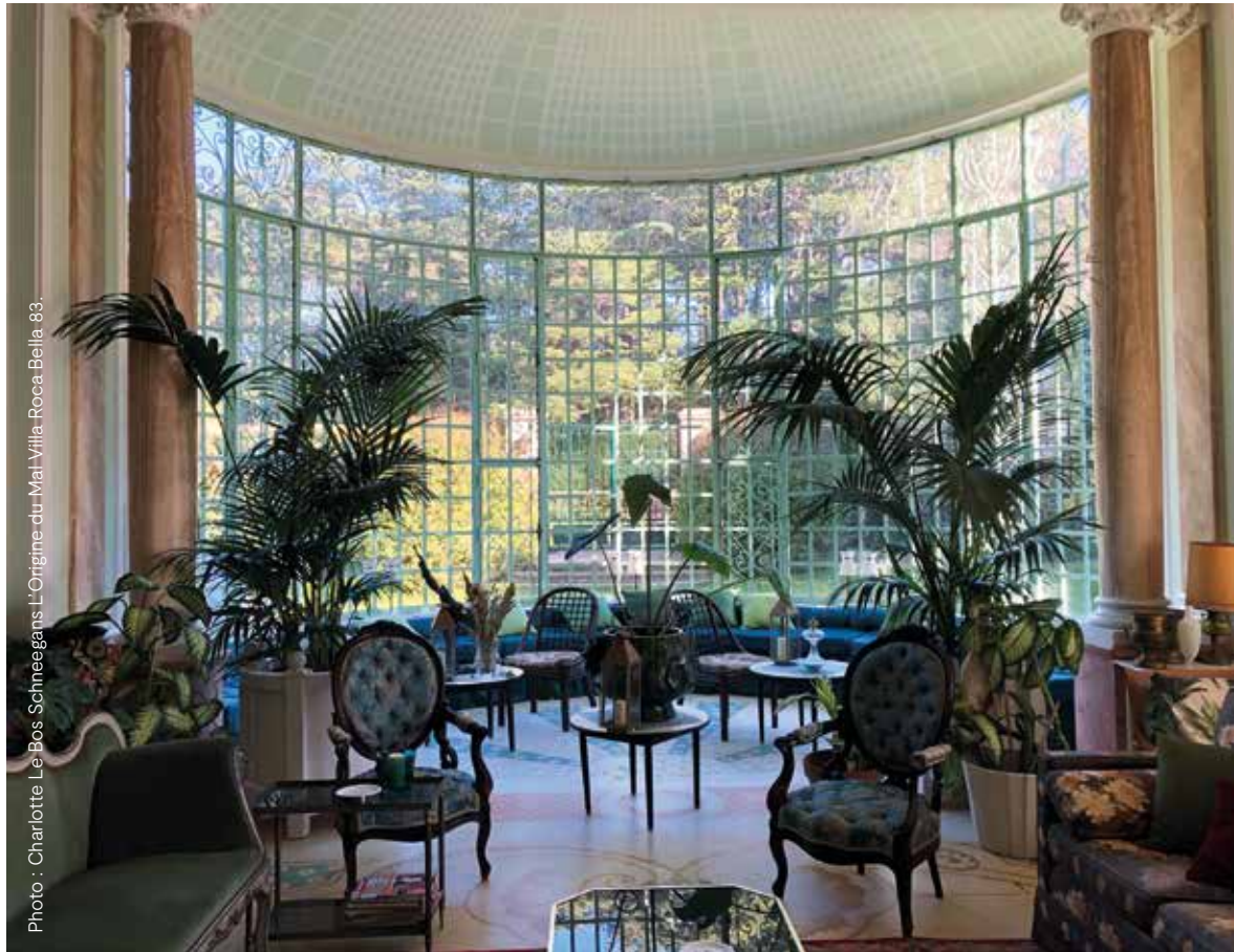
L'Origine du Mat Villa Roca Bella 88.

La base décors intitulée LOCATIONS de Film France - CNC regroupe tous les lieux de tournage français. Cette base est accessible gratuitement par tout professionnel à la recherche de décors sur son site internet : https://locations.filmfrance.net/fr .