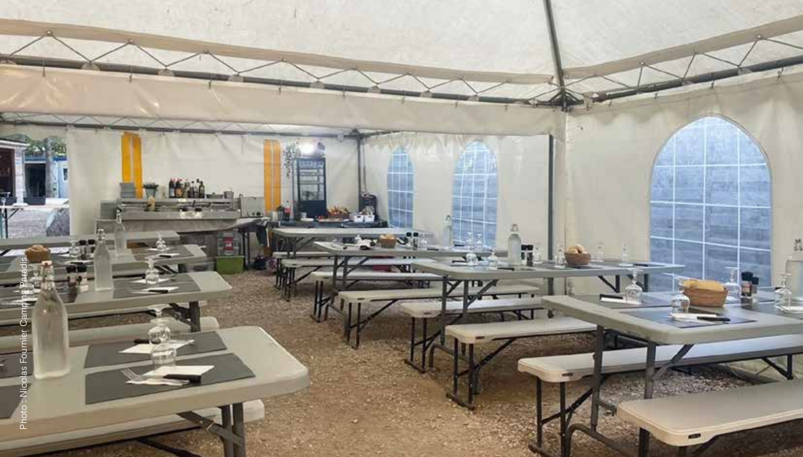
Camping Paradis.